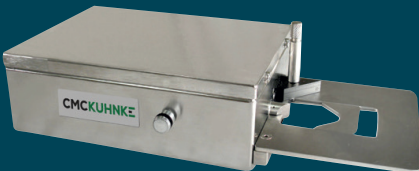
用于气雾罐检测的 VSI 型号

检测内容： 二重卷封检查：卷边厚度、卷边高度、埋头深度、卷封间隙、身钩、盖钩、迭接率