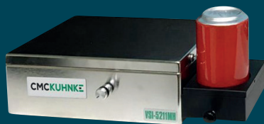
用于饮料罐检测的 VSI 型号

SEAMscan SPC 系统是一款经济实惠的高分辨率卷封投影测试系统，用于二重卷封检测，并可生成 SPC 报告。