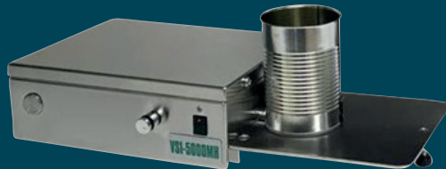
用于食品罐检测的 VSI 型号