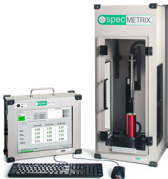
▲ SpecMetrix ACS 单罐涂层厚度与膜重测量系统

ACS 系统可为用户提供最高级别和最大量的精确涂层重量和厚度数据，采用非接触、非破坏性和实时测量所有涂层的方式。